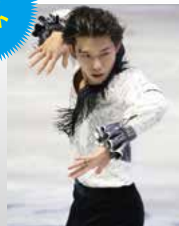
無良 崇人 フィギュアスケーター