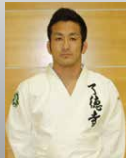
秋本啓之 世界選手権/アジア大会/グランドスラム東京・パリ金メダリスト/ 了徳寺学園柔道部コーチ/全日本柔道女子特別コーチ