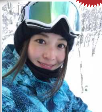
岩垂 かれん 元スノーボードクロス日本代表 平昌五輪NHK解説