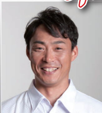
桧山 進次郎 元プロ野球選手