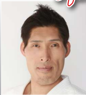
篠原 信一 柔道家